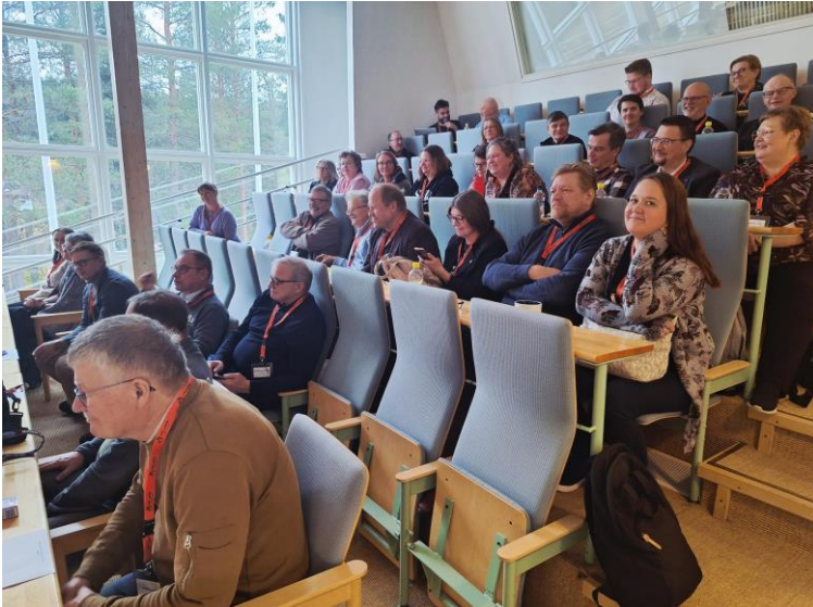
Seutuseminaarin yleisöä Posion Kirintövaarassa.