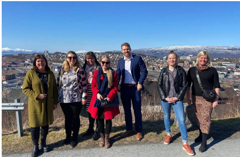
Kuva 5 NABL-hankkeen partnerit Narvikissa hankkeen loppuseminaarissa

Myös jo aiempina toimintavuosina päättyneiden kehittämishankkeiden tuotokset jatkavat tulosten tuottamista. East Lapland Film Productions -hankkeen yhteydessä toteutetun kuvauslokaatiopankin sekä Locationhouse Finland Oy:n Ilkka Mukkalan tekemän aluemarkkinointityön myötä alueella on toteutettu tv- ja elokuvatuotantoja, jotka ovat työllistäneet myös alueella toimivia yrityksiä. REDU Edu Oy on jatkanut ILPO – Malminetsinnän aluetaloudelliset vaikutukset ja niiden hyödyntäminen Itä-Lapin elinkeinoelämässä -hankkeessa käynnistettyä Malminetsijän urapolulle -työvoimakoulutuksen järjestämistä. Lisäksi REDU on saanut hankerahoituksen METSO-hankkeelle, jonka tavoitteena on rakentaa kolme uutta koulutuskokonaisuutta malminetsinnän osaamisen kehittämisen tueksi.