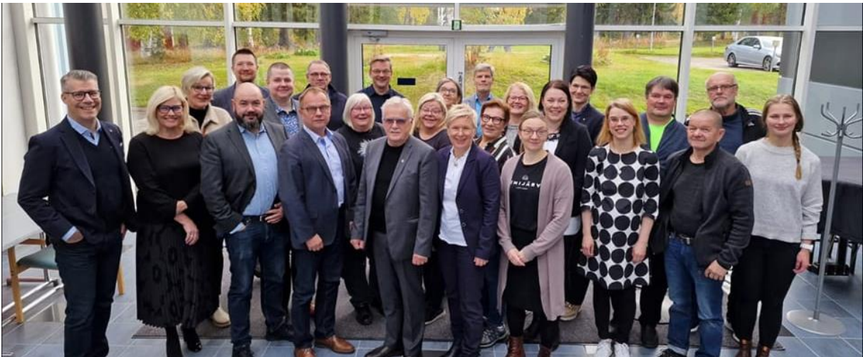
Kuva 2 Lapin liiton seutukuntakierros Kemijärvellä 22.9.