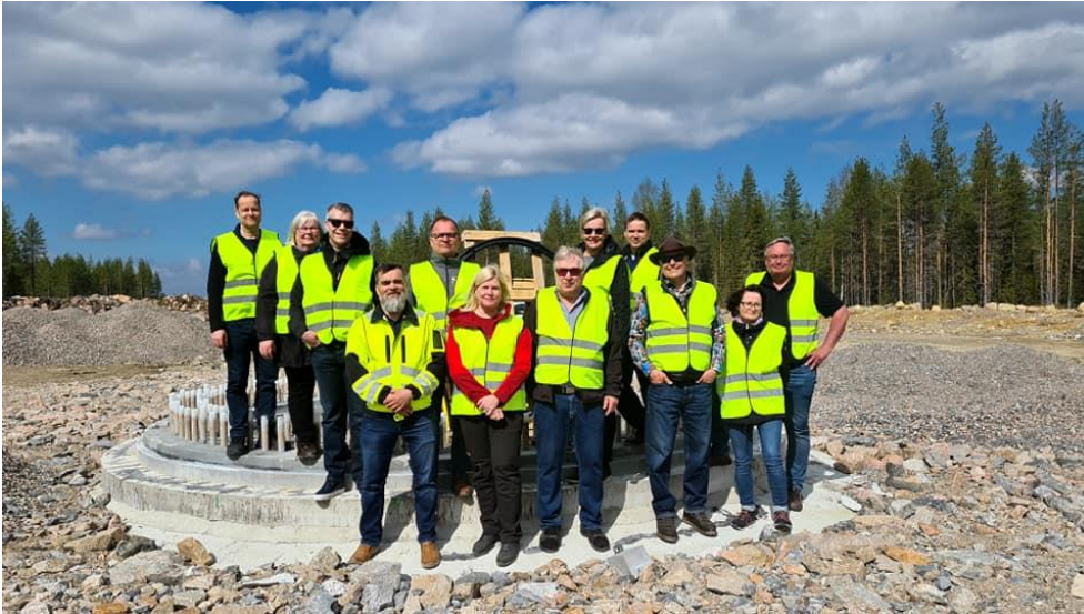
Kuva 1 Yhtymähallituksen vierailu Nuolivaaran tuulipuistoalueella 31.5.

8.12.2022 kannanotto MMM Metsästyslaki, metsästyslupien myynti ja metsästysoikeuden vuokraaminen