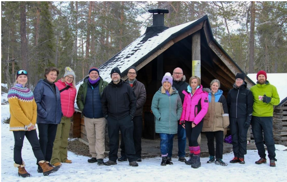
Kuva 4 SUB-hankkeen Innovation Camp Pyhätunturilla huhtikuussa 2022.

Toimintavuoden aikana käynnistyi NPA-rahoitteinen SUB – Sustainable Arctic and Peripheral Biking Tourism -siltahanke. Hankkeessa pääpartnerina toimi Itä-Lapin kuntayhtymä ja partnereita oli Skotlannista, Irlannista, Islannista ja Färsearilta. Hanke päättyi kesäkuun lopussa. Hankeaikana toteutettiin partnerikohtaiset sidosryhmäselvitykset ja toteutettavuusanalyysit vastuullisesta pyörämatkailusta, joiden pohjalta valmisteltiin varsinainen hankehakemus NPA 2021-2027 - rahoitushakua varten. Hankeaikana partnerikonsortio täydentyi ruotsalaisella ja suomalaisella (LUKE) partnerilla. Hankehakemus jätettiin joulukuussa, ja rahoituspäätös on odotettavissa kevään aikana. Yhteistyötä partnerikonsortion kanssa on jatkettu myös hankkeen valmistuttua, ja tarkoituksena on myös tulevaisuudessa kehittää yhteishankkeita.