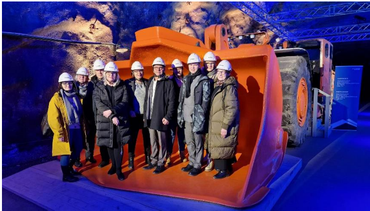
Kuva 3 Yhtymähallituksen tutustumismatka Pohjois-Ruotsiin. Käynti Kiirunan kaivoksella 1.12.